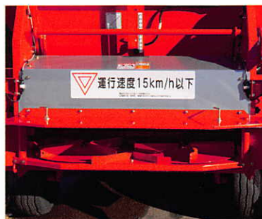
運行速度ステッカー