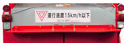
運行速度ステッカー