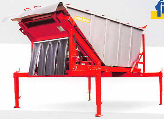
搭載ダンプベッセル DDV-4010BN