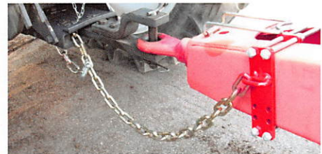
セーフティーチェーン