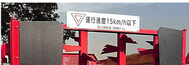
運行速度ステッカー