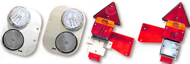
フロント&テールランプ