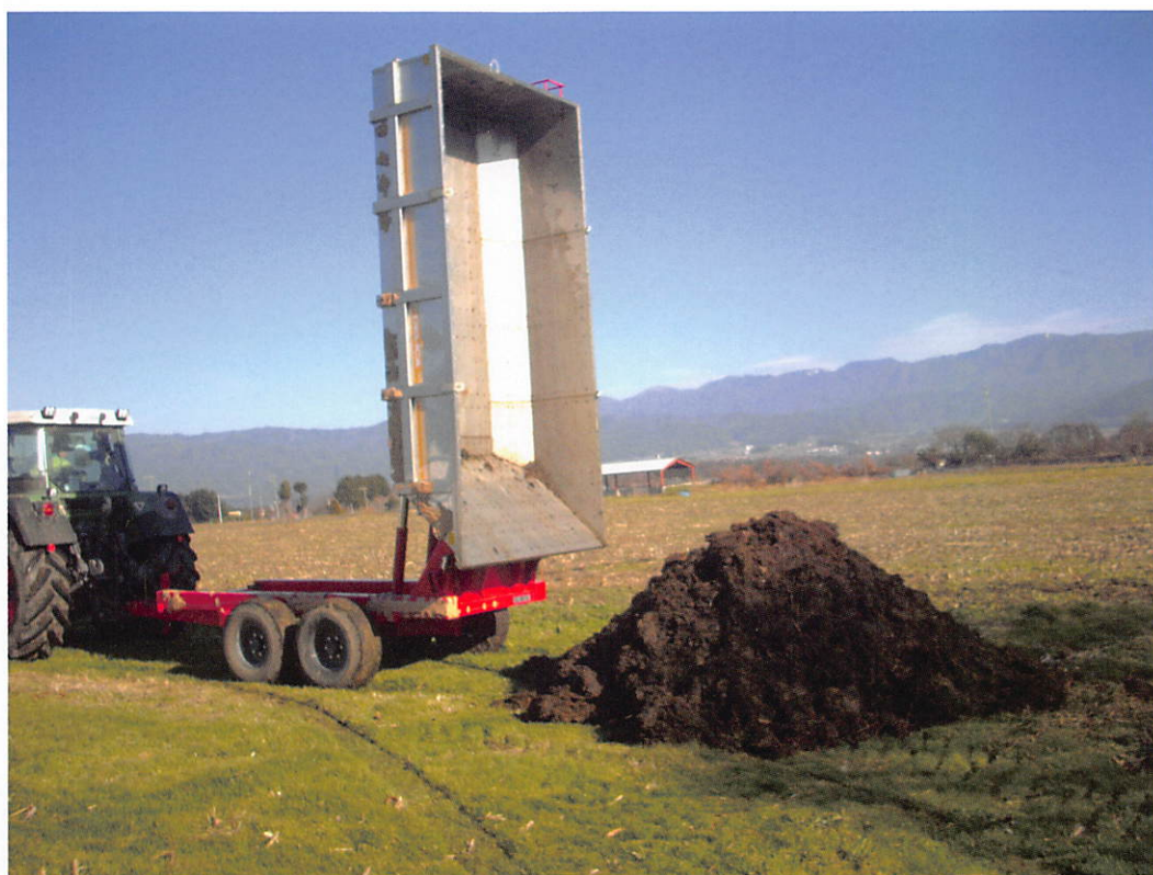
約 90 度のダンプ (DTD-7505)