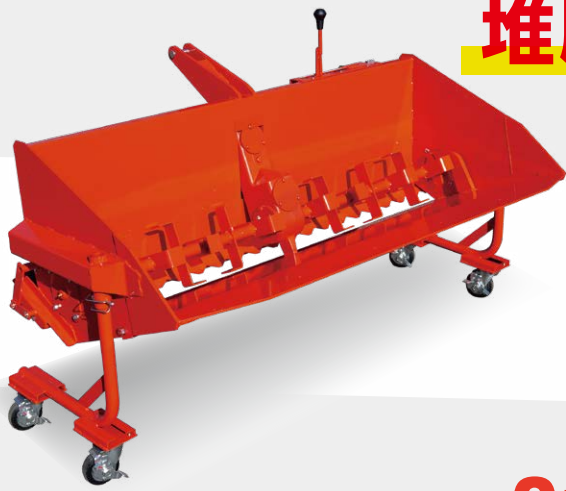
積込バケットマニア DM-1510RN