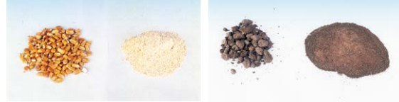
もろこし、大豆、麦等を飼料に 乾燥固形堆肥の袋詰用に

もみがらだけでなく、もろこし、大豆、麦、貝がら、ダンボール、木材チップなどの粉碎にも使えます。 ※水分を多く含むものは粉碎できません。