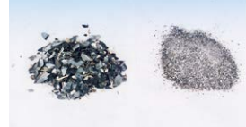
貝がらを飼料、肥料に